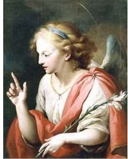
Opera di Josè Camaron Bononat- Valencia

Vogliamo prendere anche per noi l'immagine dell'Arcangelo Gabriele, che dà l'annuncio a Maria. In questa Messa, vogliamo accogliere questo progetto più grande, la tua Presenza nella nostra vita, che non si può accogliere una volta per sempre. Ogni giorno, bisogna andare in questo oltre. Passa in mezzo a noi, Signore Gesù, con questa acqua benedetta. Mentre tu ci doni questa acqua benedetta del Battesimo, noi ti consegniamo, Signore Gesù, tutte le cianfrusaglie della nave della nostra vita, per andare all'essenziale, che sei tu.